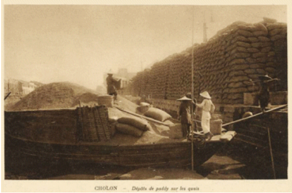
Hình 4 – Lúa được thuyền chở từ các tỉnh miền Tây đến Chợ Lớn, đổ vào bao và chất trước nhà máy trước khi được xay ra gạo

Vào năm 1921, gạo và các sản phẩm từ gạo chiếm 62% giá trị xuất khẩu từ Đông Dương, kế đó là cá (6.8%), cao su (4.4%) và than đá (3.4%). Năm 1928, trước khi có khủng hoảng kinh tế năm 1929, giá trị xuất khẩu gạo tăng lên 68%, cá giảm xuống 4.6%; than đá vẫn ở mức 3.4% và cao su giảm xuống còn 3.5%. Trong thập niên 1920, giá trị xuất khẩu của lúa gạo giao động từ mức thấp 56.6% năm 1923 đến cao 68.2% năm 1926 (2)