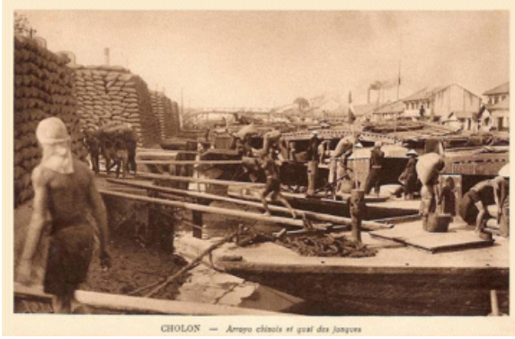
Hình 5 – Gạo trong bao (sau khi lúa đã được xay) được phu khuôn vác mang xuống ghe đến cảng Saigon để xuất khẩu hay phân phối các nơi khác

Khủng hoảng kinh tế bắt đầu từ năm 1929 cho đến năm 1933 làm giá gạo xuống thấp, sản xuất và xuất khẩu gạo giảm mạnh. Không chỉ nhiều nhà nông, thương gia lúa gạo bị phá sản mà đời sống của mọi tầng lớp trong xã hội bị ảnh hưởng nặng nề. Đời sống đều cơ cực. Nạn đói xảy ra ở hai tỉnh miền trung, Nghệ An và Hà Tĩnh năm 1930-1931.