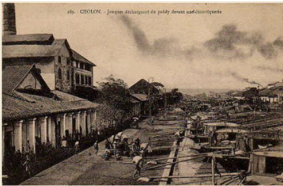
Hình 7 - Thuyền chở lúa xuống nhà máy ở Chợ Lớn – ô nhiễm không khí là do đốt vỏ trấu để chạy máy hơi nước xay lúa

Với giá gạo giảm mạnh và thuế má nặng nề, hệ quả là sự biểu tình nổi loạn của nông dân và sự tấn công vào chế độ Pháp thuộc do đảng cộng sản khuyến khích hay tổ chức trong các năm 1931-1932. Đúng thực rằng người Pháp đã mở mang trồng các loại cây trồng hay nông sản xuất khẩu như cao su, thuốc lá, cà phê, ...nhưng họ cũng không quên sự cần thiết của các loại thực phẩm cho trường hợp khẩn trương như các năm 1931-1932, bằng các biện pháp thích hợp trong cách thức đa canh của nông dân thay vì độc canh như trước để tránh nạn đói và an ninh lương thực được bảo đảm (3). Tuy vậy vẫn không tránh được những tình huống như hệ quả của cuộc khủng hoảng kinh tế gây ra.